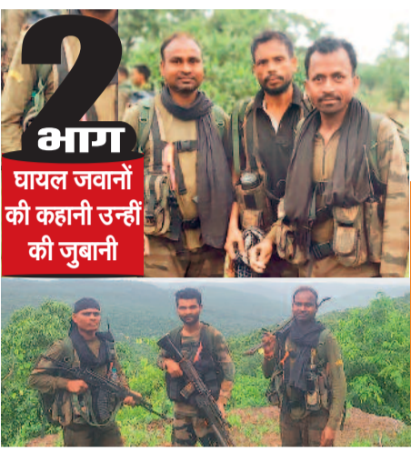
2 भाग घायल जवानों की कहानी उन्हीं की जुबानी