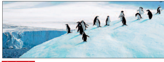
सिर्फ बर्फ ही नहीं, खाने का भी संकट पेंगुइन प्रमुख रूप से किल (छोटी मछली जैसे जीव) खाते हैं। लगातार समुद्र का तापमान बढ़ने से किल की संख्या कम हो रही है। इसके साथ ही बड़े पैमाने पर होने वाली फिशिंग (मछली पकड़ना) भी पेंगुइन के गुंठ से निवाला फिशिंग कर रही है। खाना कम होने की वजह से वयस्क पेंगुइन कमजोर हो रहे हैं और वे अपने बच्चों का पेट तक नहीं भर पा रहे हैं।

एम्परर पेंगुइन की पूरी जिनगी समुद्री बर्फ पर टिकी होती है। वे इसी बर्फ पर अंडे देते हैं, बच्चों को पालते हैं और शिकार से बचने के लिए इसका सहारा लेते हैं। लेकिन, पिछले कुछ सालों से क्लाइमेट चेंज की वजह से अंटार्कटिका की बर्फ रिपोर्ट में पिघल रही है। इसकी वजह से इनके बच्चों की मौत हो रही है। क्योंकि, पेंगुइन के बच्चों के पंख तब तक चॉटरपूफ नहीं होते, जब तक वे पूरी तरह बड़े न हो जाएं और, जब समय से पहले बर्फ पिघल जाती है, तो वे बच्चे ठंडे पानी में गिर जाते हैं और तेज़ा न आने की वजह से उनकी मौत हो जाती है।